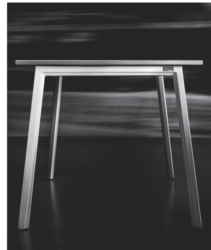
PÓRTICO EN FORMA DE COMPÁS, Y DECLINADO EN LOS DOS SENTIDOS