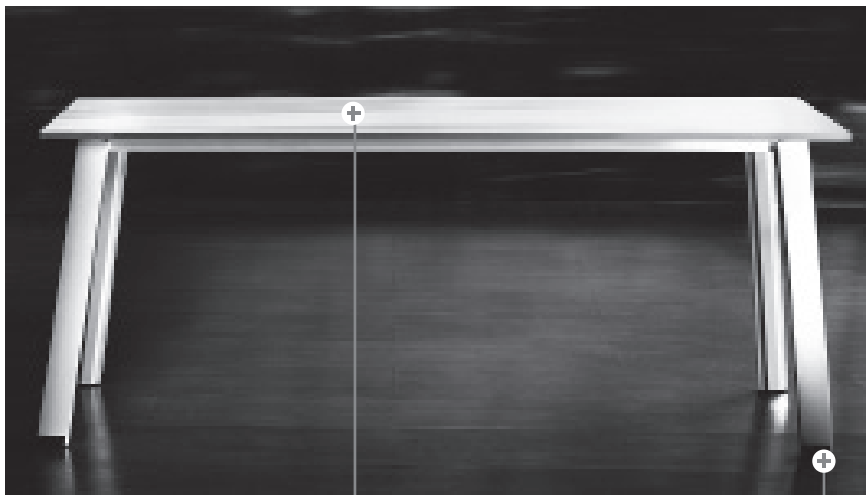
SOBRE MESA LUXE O BILAMINADA DE 19mm